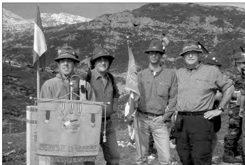
Il Vessillo sezionale era presente al 1° Pellegrinaggio al Monte Pasubio, unitamente ai Gagliardetti di Gallarate e Varese.

Alla risposta che erano presenti solo due coristi del Coro il Patriarca ha scherzato dicendo "Allora non cantate perché non siete in trentatre?". Il Patriarca ha ricordato con piacere la visita che fece nel 1997 al Sacro Monte di Varese e annunciato che attende per il 30 novembre prossimo la visita ad Istanbul del nostro Papa Benedetto XVI. Gli Alpini sono andati in avanscoperta! Tutto ok!